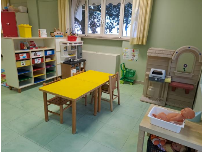
ANGOLO SIMBOLICO E DELLA CURA