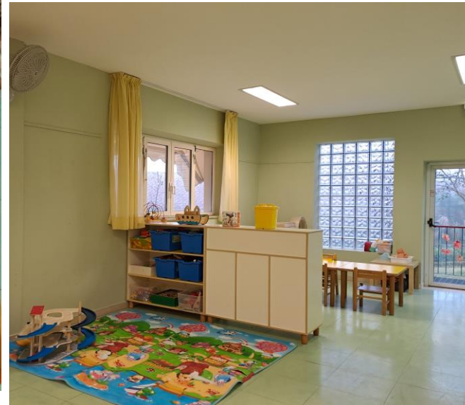
ANGOLO COSTRUTTIVITA' E MACCHININE