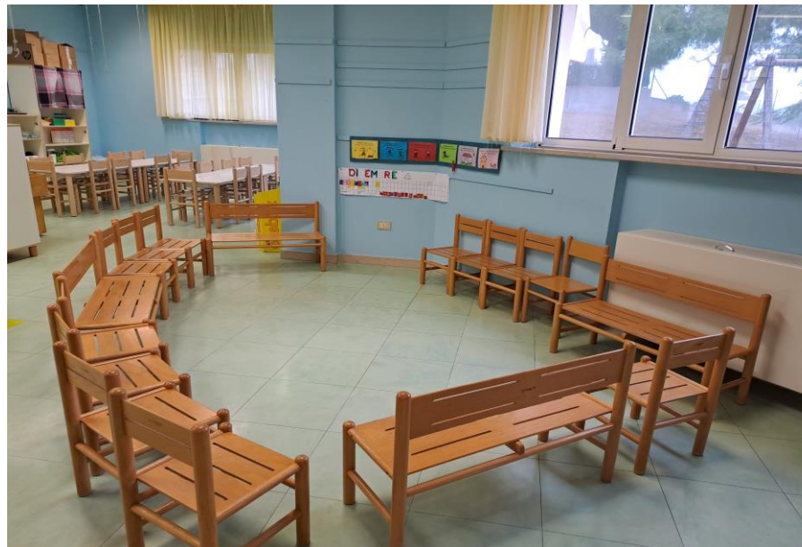
ANGOLO DELLA CONVERSAZIONE