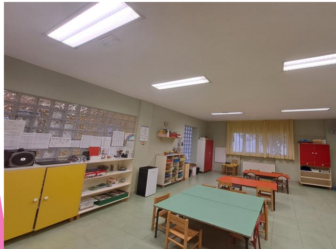
ANGOLO GRAFICO E MANIPOLATIVO E TRAVASI