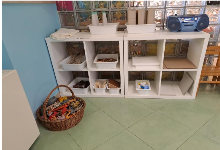
ANGOLO COSTRUZIONE AMBIENTI CON MATERIALE DESTRUTTURATO