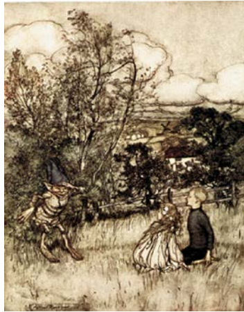
La Canzone di Puck

Puck, "la Cosa più Vecchia dell'Inghilterra", come si definisce lui stesso, utilizza con competenza informazioni storiche per storicizzare il territorio.