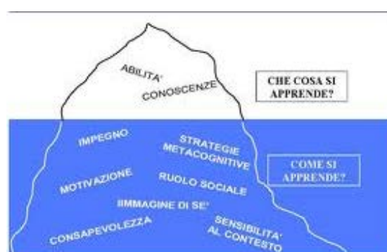
Figura 1. Costrutto della competenza secondo Mario Castoldi

Il concetto di competenza è complesso da circoscrivere (Castoldi, 2009, p. 51); la sua articolazione interna determina la problematicità dell'accesso didattico: come si costruisce una competenza, quali processi si attivano, qual è il ruolo del contesto, come si valuta?